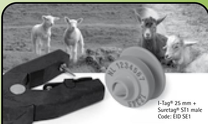
I-Tag® 25 mm + Suretag® ST1 male Code: EID SE1